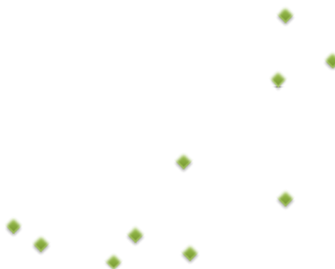
График 24. Плотность сети АЗС в Европе

По нашим оценкам к концу 2020 года этот показатель плотности составит -//- -//-/- км для трасс М, для трасс А, Р, других с небольшим потоком автомобилей -//-/-/-/-/- км.