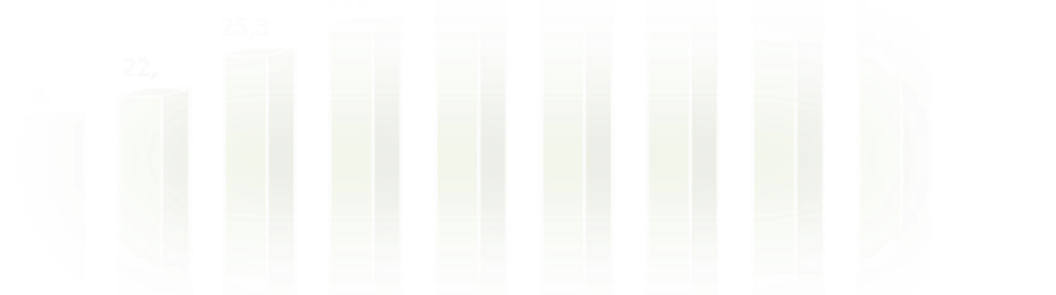
Диаграмма 18. Динамика цен на бензин марок АИ-92 и АИ-95 за январь 2016 г. – май 2018 г., руб/т.