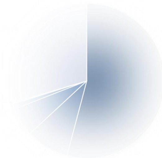
Таблица 14. Импорт трубопроводной арматуры в проекты в нефтегазовой отрасли в 2019 г.