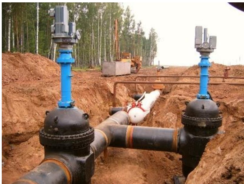
Рисунок 26. Установка магистральной шиберной задвижки

Распределение арматуры для транспортировки нефти по диаметру следующее: